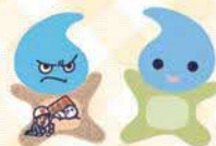
マスコットキャラクター みずよちゃん よすみちゃん